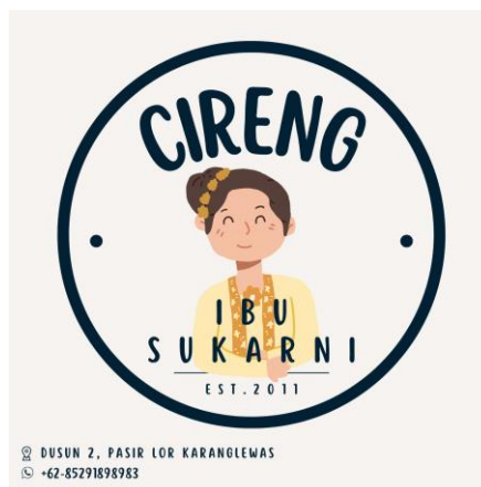
Gambar 3.2 Logo Cireng Sukarni

Kotler (2008) mendefinisikan merek ( brand ) untuk mengidentifikasi barang atau jasa dan untuk mendiferensiasikannya dari barang atau jasa pesaing. Tetapi, Cireng Sukarni belum memiliki identitas yang konsisten dan kemasan yang menarik sehingga dirancang brand identity berupa logo dan diaplikasikan pada desain kemasan untuk mendukung citra yang ditonjolkan. Logo tersebut akan menjadi identitas untuk Cireng Sukarni.