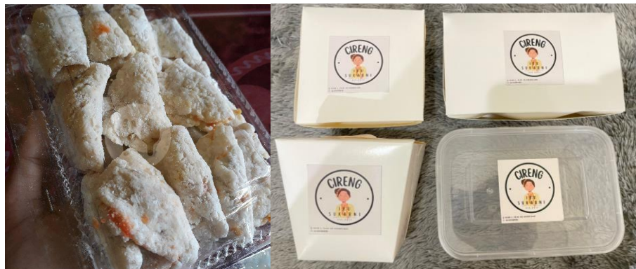
Gambar 3.1 Kemasan Sebelum dan sesudah dilakukan Pendampingan

Kemasan Cireng Sukarni sebelum dilakukan pendampingan yaitu berupa plastic mika saja. Hal ini memperlihatkan bahwa Cireng Sukarni sangat lemah pada Brand Identity . Dengan pendampingan yang dilakukan maka peneliti memberikan arahan untuk mengkaji ulang mengenai kemasan yang akan digunakan. Peneliti mengajukan beberapa pilihan kemasan seperti menggunakan paper lunch box , box mika , serta plastic sealer . Kemasan yang dibuat untuk Cireng Sukarni ada beberapa macam seperti kemasan siap saji dan frozen . Untuk kemasan siap saji juga tersedia dengan beberapa bentuk kemasan sesuai dengan jumlah cireng yang dipesan, kemasan paketan yang digunakan untuk frozen dapat menggunakan box mika dan plastic sealer .