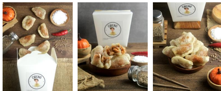
Gambar 3.5 Foto Katalog Produk