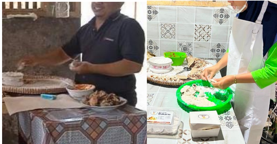
Gambar 3.3 Peningkatan Hygiene Produk sebelum dan sesudah diberikan pendampingan

Berdasarkan hasil penelitian, teori serta penelitian terkait, maka peneliti berpendapat bahwa karyawan Cireng Sukarni seharusnya memakai APD seperti celemek, mouth shield , dan topi untuk menghindari kontaminasi dari bagian tubuh seperti rambut dan kotoran di baju sehingga tidak terjatuh ke makanan, dan mencuci tangan sebelum produksi cireng. Pentingnya mencuci tangan sebelum mempersiapkan makanan untuk menghindari kotoran dan bakteri yang menempel di tangan karena perilaku pedagang yang sering tidak sengaja menyentuh alat-alat yang kotor.