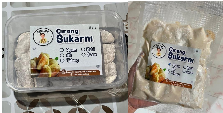
Gambar 3.4 Label Produk

Setelah adanya kegiatan berupa pendampingan pembuatan label. Berdasar hasil identifikasi dan penilaian terhadap kemasan dan juga desain produk yang ada di beberapa UMKM. Maka terdapat hal yang perlu diperbaiki yakni terkait dengan label produk yang tidak sesuai dengan standar label yang ada. Seperti tidak mencantumkan tanggal kadaluwarsa, nama UMKM yang membuat, varian rasa, alamat, dan nomer telepon. Maka peneliti membantu UMKM dengan menguji tanggal kadaluarsa produk dan merancang label yang sesuai