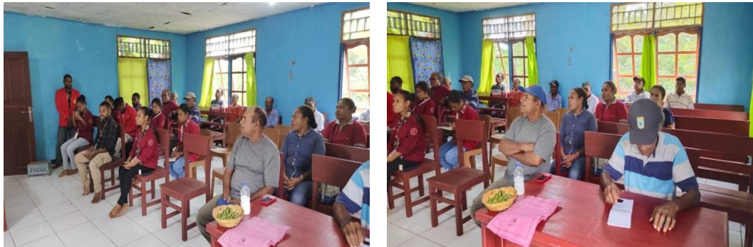
Gambar 1 Aktivitas Kelompok Penyuluhan

pemahaman mengenai pemberdayaan, maka dalam wacana praktik pembangunan pemberdayaan dipahami secara beraham, yang paling umum adalah pemberdayaan disepadankan dengan partisipasi, padahal keduanya mengandung pengertian dan spirit yang tidak sama. Berikut beberapa aktifitas yang dilakukan dalam proses penyuluhan Peran Kamar Adat Pengusaha Papua (KAPP) di Distrik Sentani Timur yang dilakukan oleh Fakultas Hukum Universitas Cenderawasih sebagai Berikut :